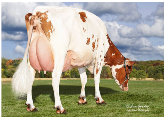
AOT SWINGMAN HALIA-RED DAM